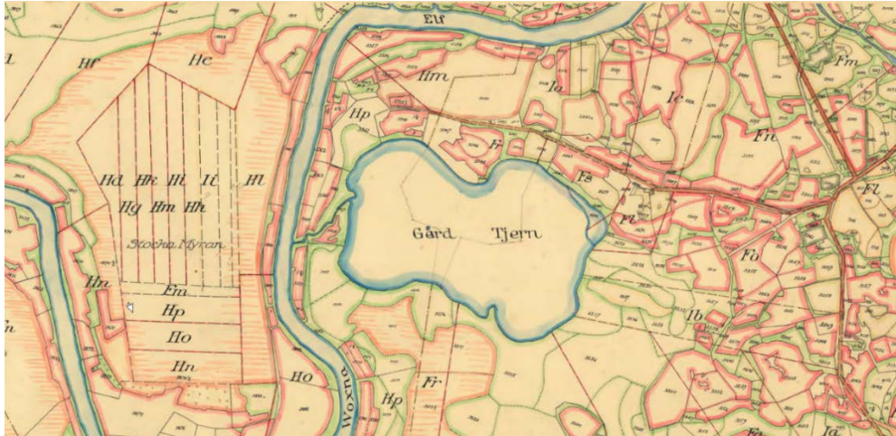
Karta från laga skifte, sent 1800-tal