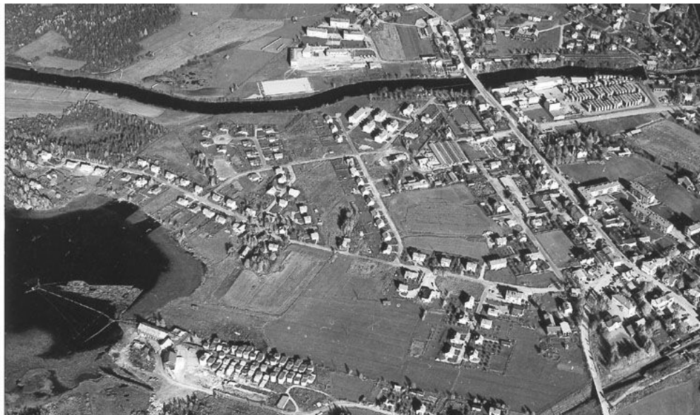
Gammal flygbild (före 80-talet) där den del av Gårdtjärn där förbindelsen enligt vissa källor ska ha funnits framgår.

Man kan således konstatera att det nog finns delade meningar om huruvida en förbindelse med Voxnan åt norr har funnits eller inte och även om det vore tillfredsställande att ha ett absolut svar, så är det i dagsläget mycket intressantare att i stället lägga tid och energi på att titta framåt för att se hur Ovanåkers kommun skulle kunna hjälpa till att förbättra vattenkvaliteten samt stärka Gårdtjärns värden.